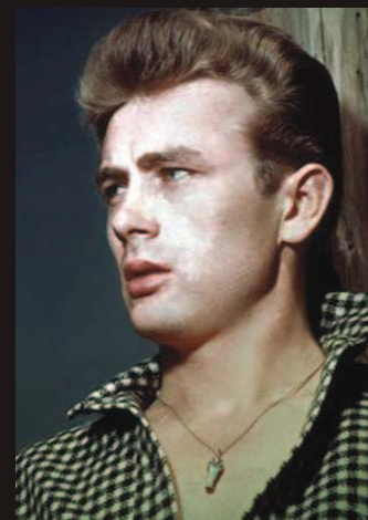
James Dean (*8.2.31 - 30.9.55)

Zwei Plattenfirmen haben bereits Ellas McDaniel als Urwaldmusiker abgelehnt, als er den Song „Unde John“ beim Chess-Label, wo auch Muddy Waters und Chuck Berry ihre Platten aufnehmen, vorsingt. Nach der Umbenennung des Titels in seinen ehemaligen Boxernamen erreicht „Bo Diddley“ Platz 1 der Rhythm & Blues-Charts. Ursprünglich mit einer Gitarre unterwegs, zusammengebaut aus einer alten Uhr und Autoteilen, hat er nun das Geld, sich eine rechteckige Gitarre zu bauen - schon bald neben dem stampfenden Rhythmus sein Markenzeichen.