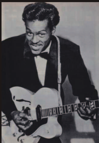
Chuck Berry (*18.10.26)

Selbst im neu eröffneten Disneyland im kalifornischen Anaheim wackelt Micky Mouse verdächtig mit den Ohren.